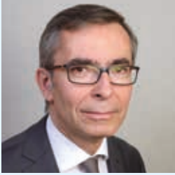
PASCAL DE WILDE DIRECTEUR DES HÔPITAUX UNIVERSITAIRES EST PARISIEN